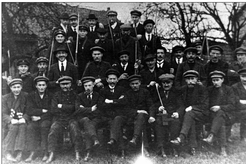
De schutters van Altijd in Roeren in lang vervlogen tijden.

Veel is er echter niet bewaard gebleven over deze schuttersvereniging, maar we vonden wel een mooie beschrijving van de eerste koningssschieting na de Eerste Wereldoorlog.