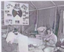
Wildbreien één van de nieuwe activiteiten. Dames van de rusthuizen uit Essen, Kalmthout en Wuustwezel hebben reeds maanden voor ons gebreëen.