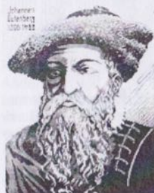
Johannes Gutenberg 1400-1468 Gutenberg de uitvinder van de losse drukletter. Grootte lettercorps 8 punt, 4 letterbeelden, aantal tekens 50.688. Gedrukt op een Marinoni pers, uit de 19e eeuw, van de Historische Drukkerij te Turnhout.