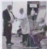
Toneelgroep "Elck wat Wils".