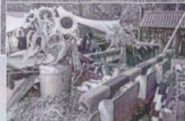
Vorbereitung op het terrein Wildbreißen

Enkele vrijwilligers van het Karrenmuseum gingen pikken op 16 augustus. Met paard en kar werd het graan daarna naar het Karrenmuseum gereden. Zo kan op de Ambachtendag van 26 augustus het graan gedorst worden.