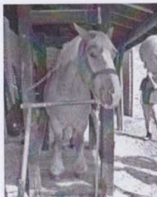
Paarden werden beslaan.