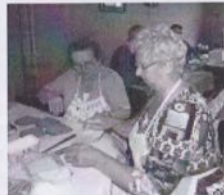
Vrijwilligers zorgen voor eten en drinken.