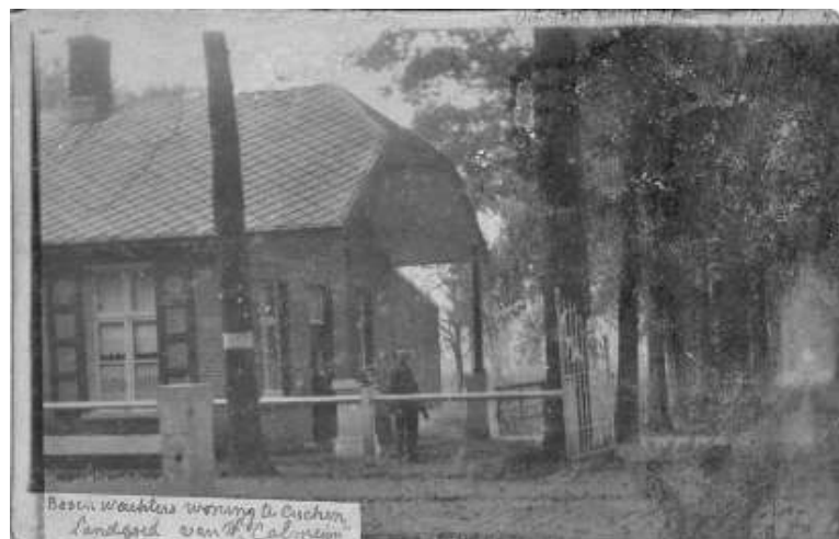
Besou waachters woning te Cuschem Landgoed van H. Calverley